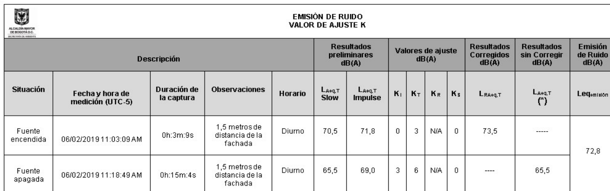
Tabla No. 8 Zona de emisión Planeadora

Nota 13: El nivel de emisión de ruido o aporte de ruido, reportado en el presente documento técnico es de (74,7 ± 0,71) dB(A) (Ver Anexo No. 7 Valores de ajuste K.zip)