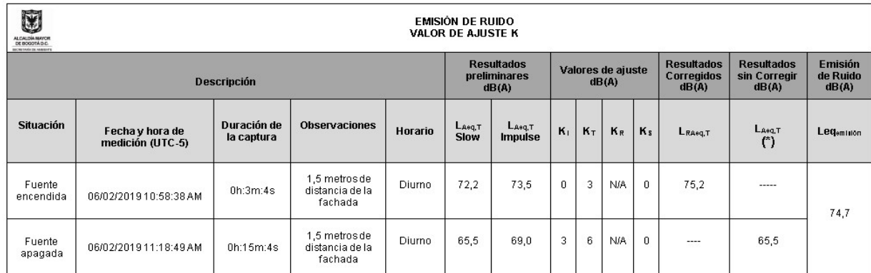
Tabla No. 7 Zona de emisión Sierra